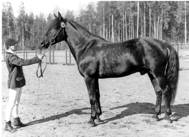
Ori Samuli vuonna 1994, esit. Tupuna Kangas.