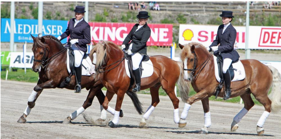
Sh-ratsut vuonna 2011.